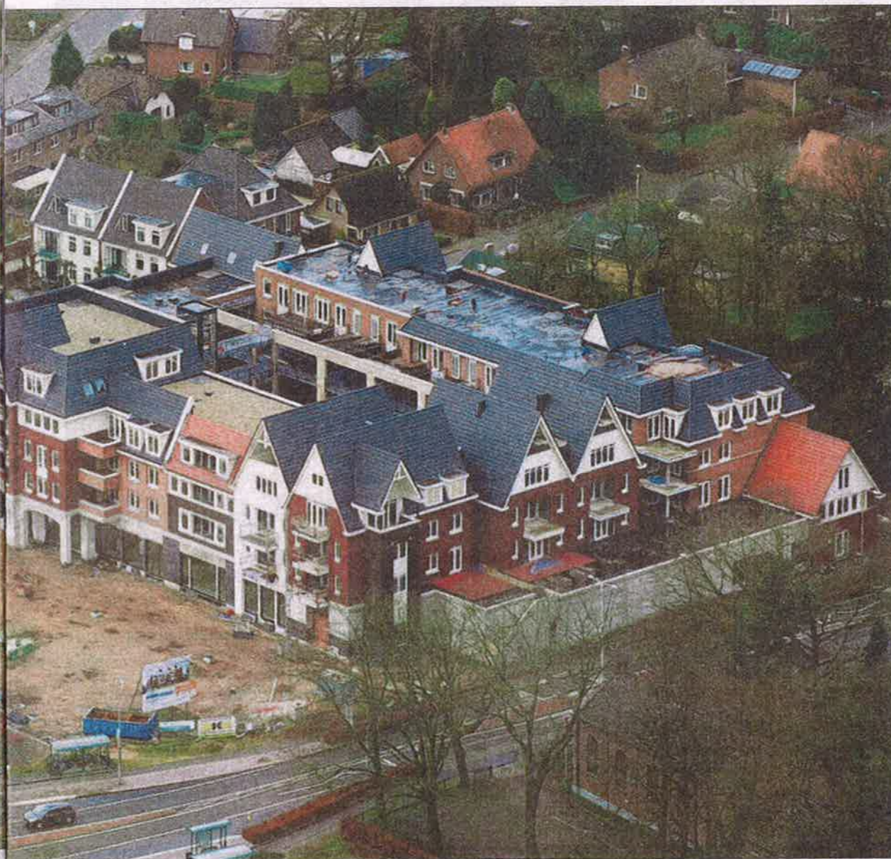
Het enorme appartementencomplex dat onderdeel uitmaakt van project de Verbinding is zo goed als klaar. De bedoeling is dat de nieuwe bewoners in april hun appartementen betrekken.