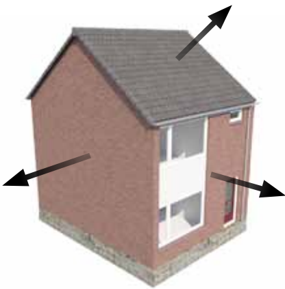
1 - bestaande geveldelen en dakpannen worden verwijderd

Centraal bij schilrenovatie staat het vervangen van de voor- achter – en kopgevel plus het dak van de woning. Bij een groot deel van het Nederlandse woningaanbod is dat een relatief kleine ingreep. Na het verwijderen van de bestaande gevels worden in één handeling nieuwe, prefab gevels geplaatst. Inclusief kozijnen, ramen en deuren; en inclusief alle doorvoeren voor kabels en leidingen. Indien een kruipruimte aanwezig is wordt de begane grondvloer van isolatie voorzien. Op die manier krijgt de woning een alles omsluitende, comfortabele en eigentijdse jas.