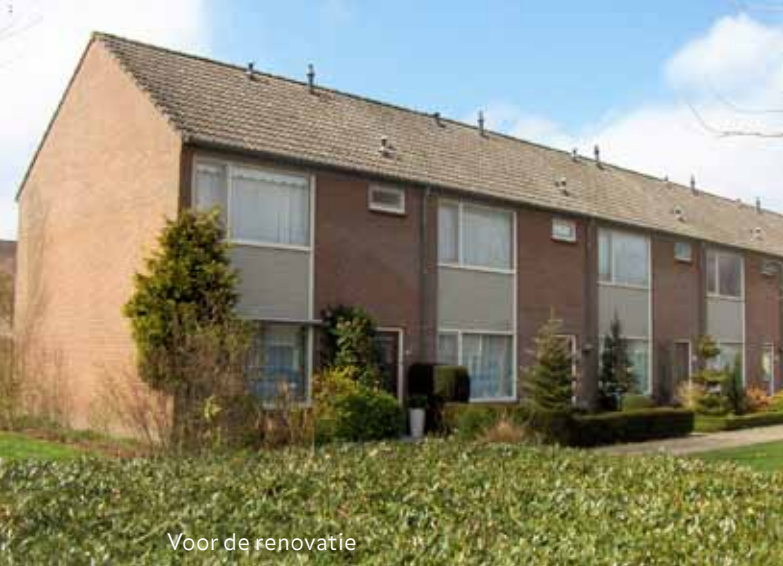
Voor de renovatie