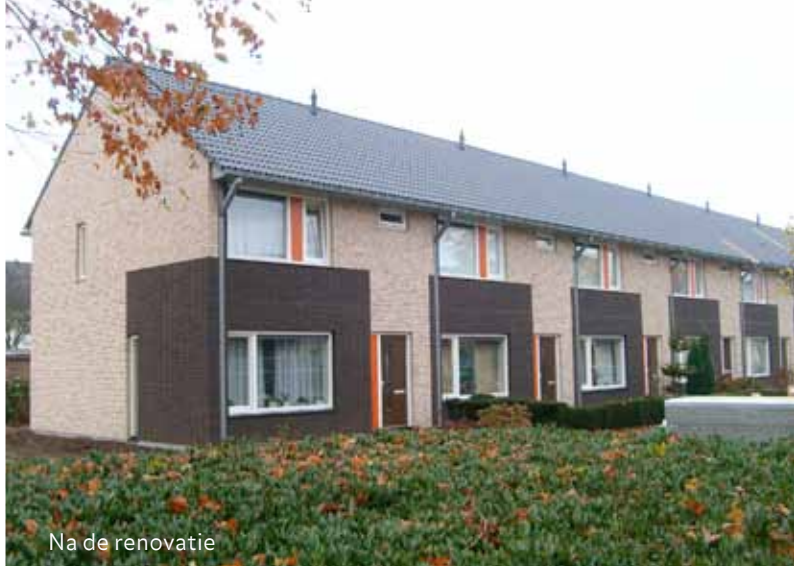
Na de renovatie