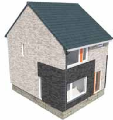
3 - de woning voorzien van een nieuwe gevel en dak