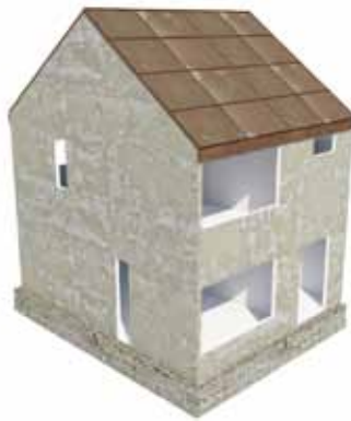
2 - de gestripte woning